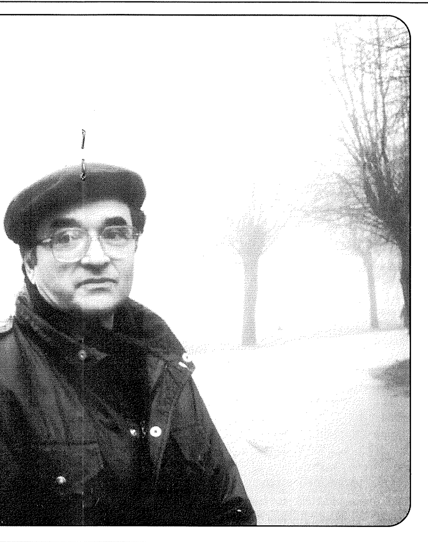
ustuu ajatukseen kohdata potilaat heidän terveiden puolien varassa.

ne ei varsinkaan sotavuosina ollut hänelle vieras, eivät liioin varhaiset kipeät menetykset.